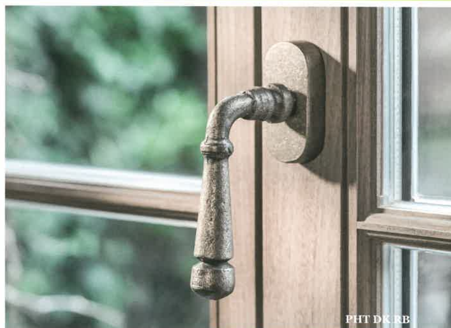
PHT DK RB

Het deur-, raam en meubelbeslag van Dauby is gegoten in zandmallen op authentieke wijze en volledig met de hand afgewerkt. Dit ambachtelijke productieproces geeft de typische kleine imperfecties die zorgen voor een oude, verweerde look.