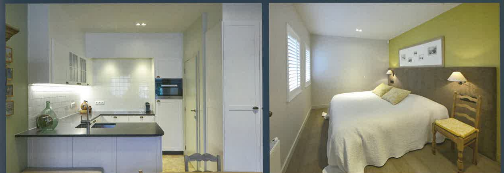
Een van de drie appartementen in het huis.

De eigenaar heeft de authenticiteit nog vergroot door er schilderijen te hangen uit zijn eigen familiecollectie. In de hal een portret dat zijn vader van hem schilderde toen hij kind was, in de eetkamer één van zijn moeder toen ze jong was. Ook in de rest van het huis hangen vooral tekeningen en schilderijen met een karakter dat past bij de maritieme omgeving, zoals ook de keuze van meubelen een klassieke stijl weerspiegelt en geen industriële. De warmte en het evenwicht die het huis uitstralen mochten niet doorbroken worden door een niet-passende inrichting.