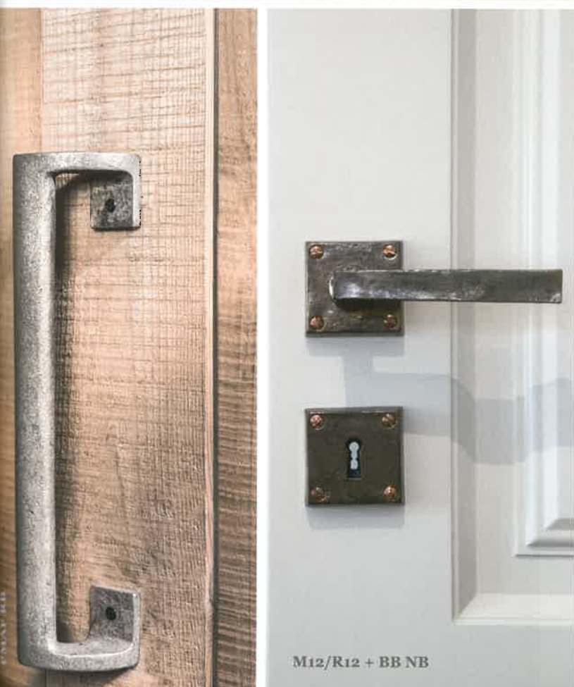
M12/R12 + BB NB