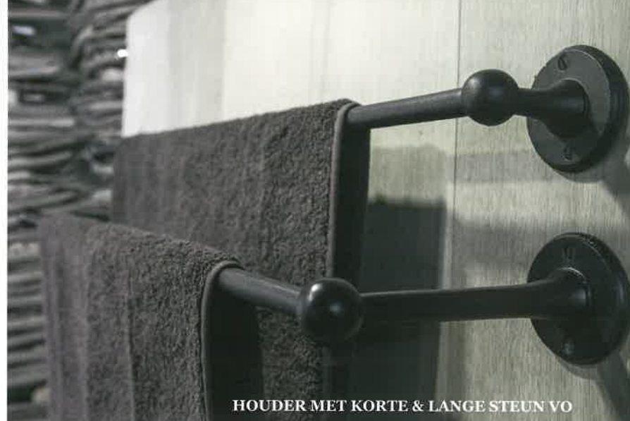
HOUDER MET KORTE & LANGE STEUN VO

Details zorgen voor perfectie, maar perfectie is geen detail.